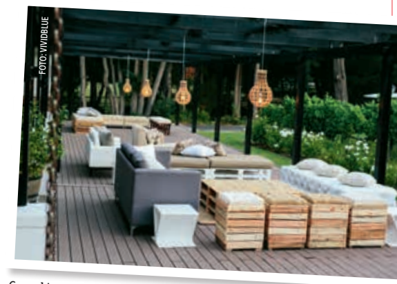
Casual Lounging: eine perfekte Kombination aus komfortablen Sofas, rustikalen Hockern, niedrigen Tischen und ausgefallenen Leuchten.